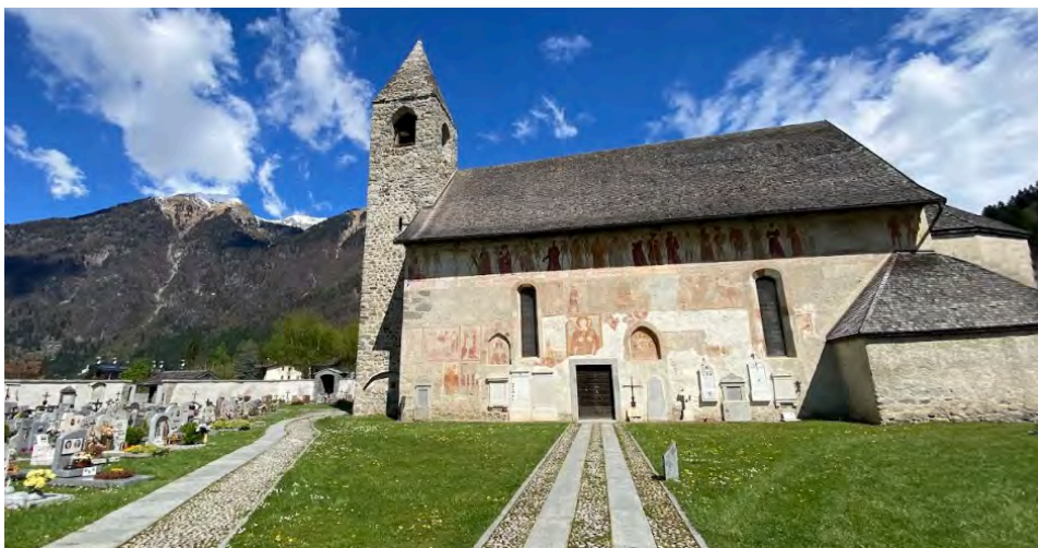
L'antica chiesa di San Vigilio in Pinzolo

Beethoven Grande Fuga in si bemolle maggiore op.133