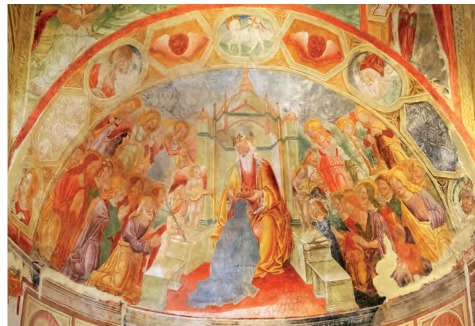
Incoronazione della Vergine.