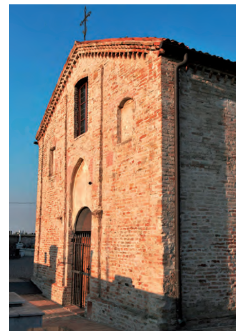
Marcaria Chiesa cimiteriale di San Giovanni Battista, fine sec. XV.

Beethoven Quartetto in fa maggiore op. 18 n. 1