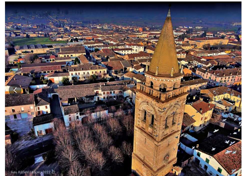
Il possente campanile della Chiesa di San Tommaso (XVI secolo)