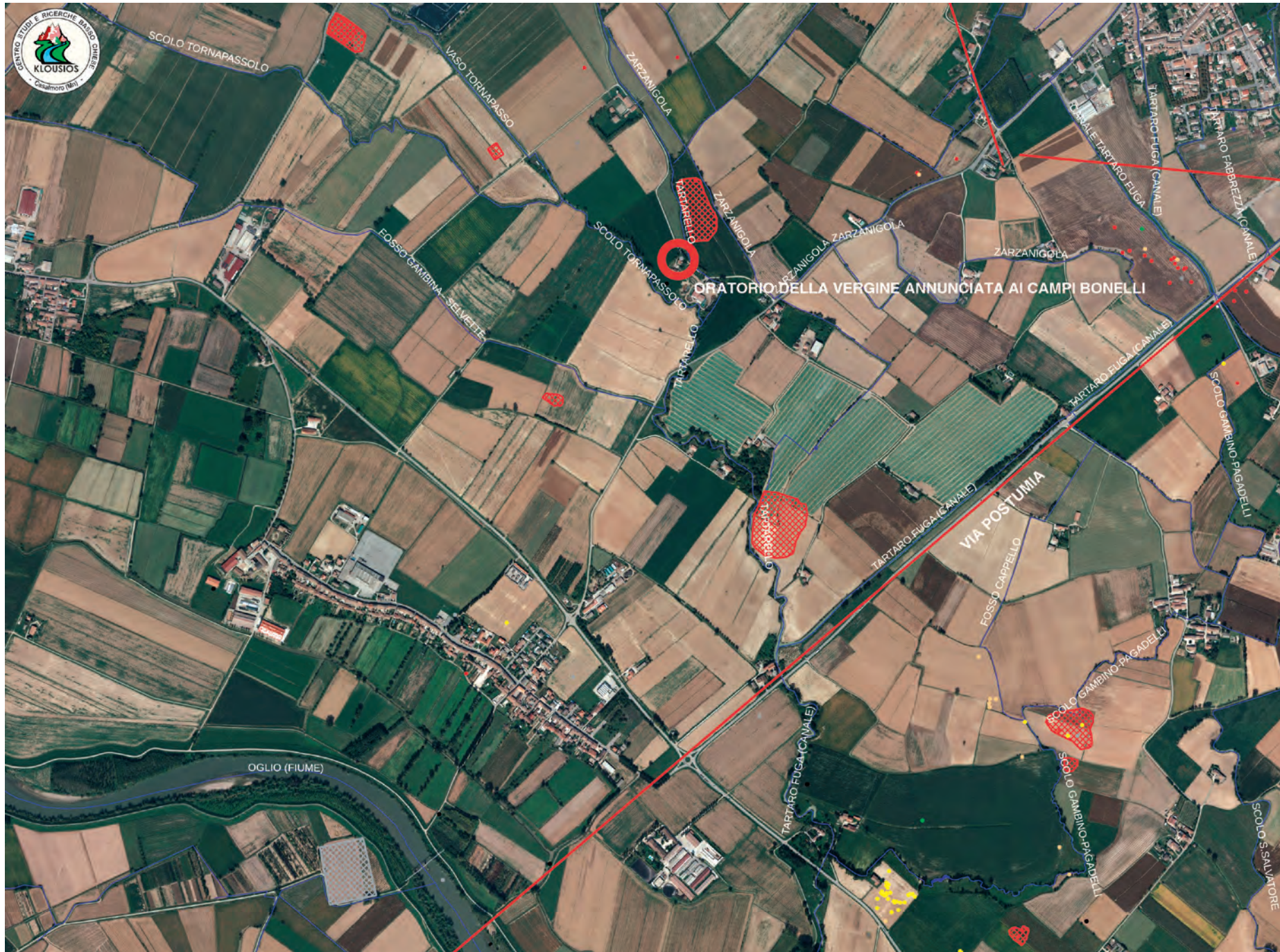
L'Oratorio dell'Annunciazione ai Campi Bonelli tra la via Postumia e il fiume Oglio