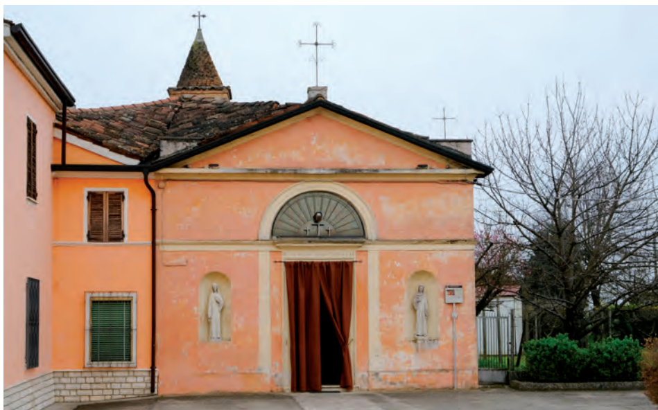
Fossato di Rodigo, Oratorio di Santa Maria dell'annunciazione "Regina Della Misericordia"

Omaggio alla tomba di Ippolito Nievo Pietro Mascagni Elevazione dalla Messa di Gloria