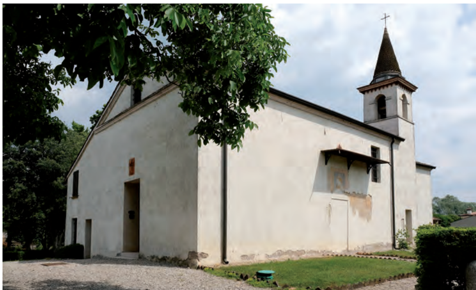
Massimbona, San Pietro in Vincoli.

Beethoven Quartetto in fa minore op. 95 "Serioso"