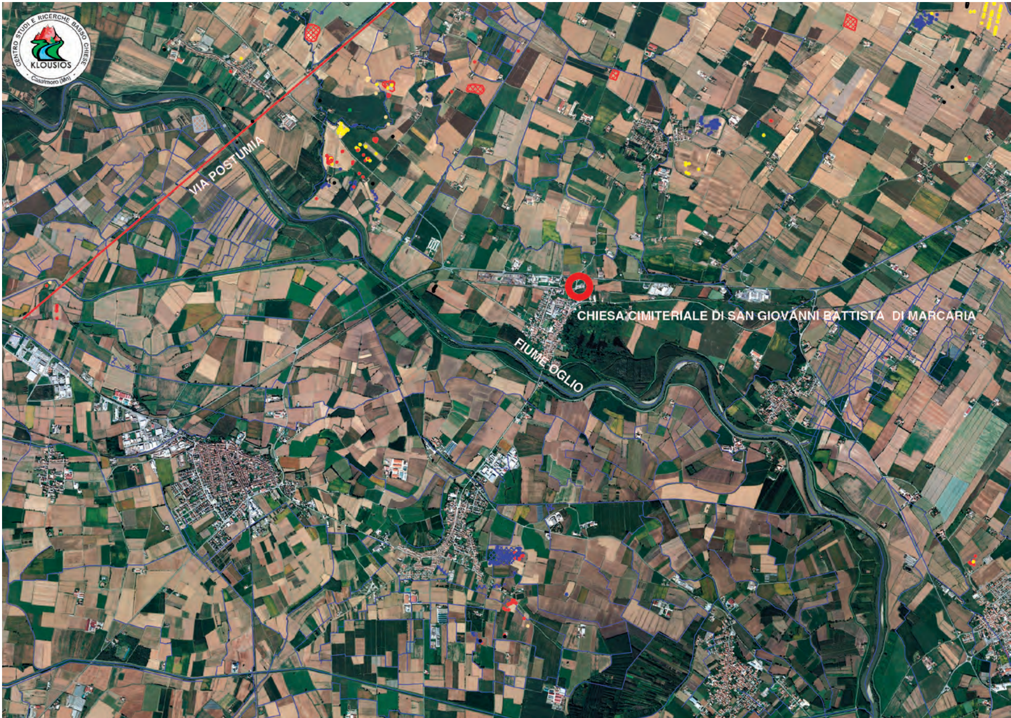
L'Oratorio cimiteriale di Marcara tra via Postumia e fiume Oglio