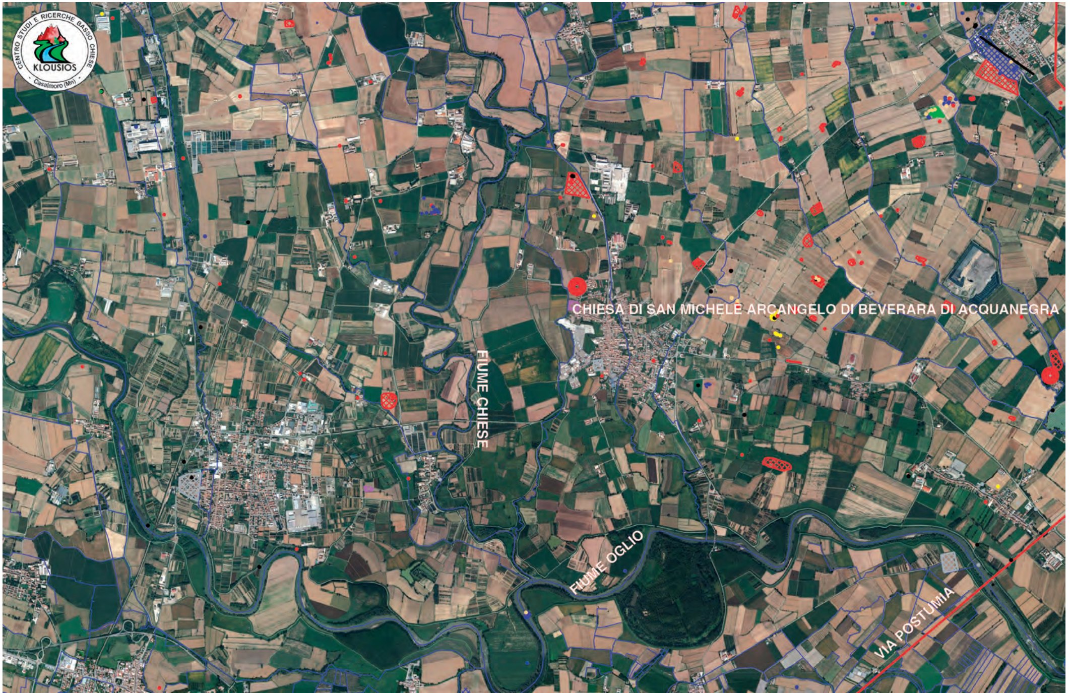
La Chiesa di Beverara immersa nei territori dei fiumi Chiese ed Oglio, lambiti dalla via Postumia