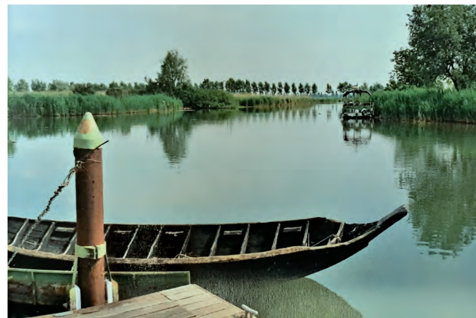
Il Mincio prima di Mantova