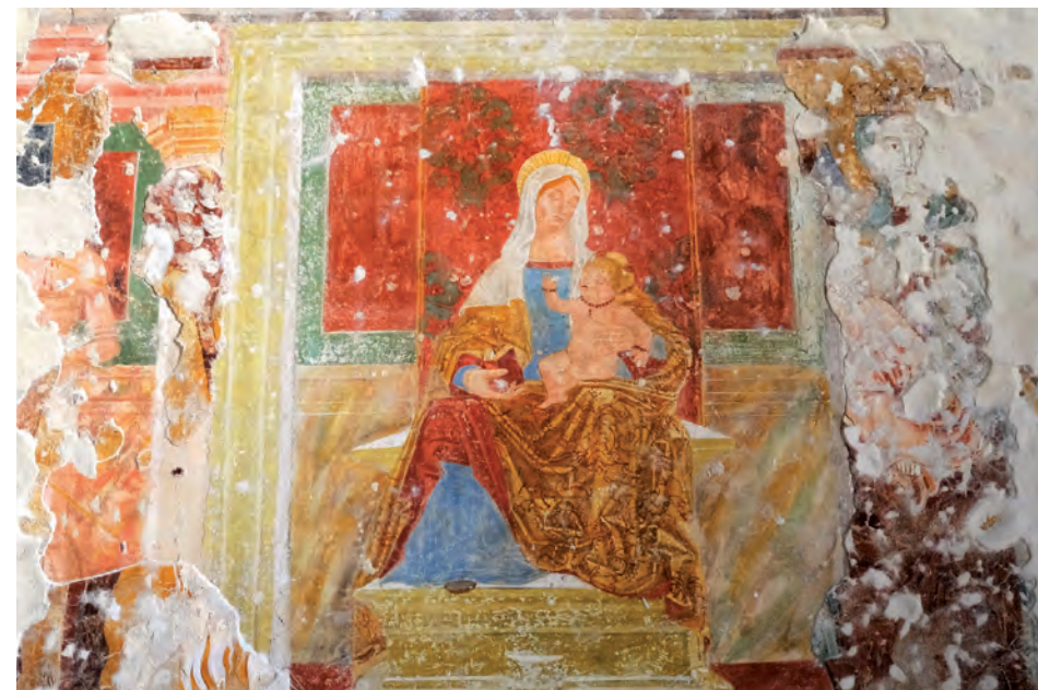
Massimbona, San Pietro in Vincoli, Madonna in trono.

La pieve esisteva certamente prima ancora della nascita di Matilde di Ca- nossa (1046-1115). E proprio nel 1037, a poca distanza da Bonago, nella