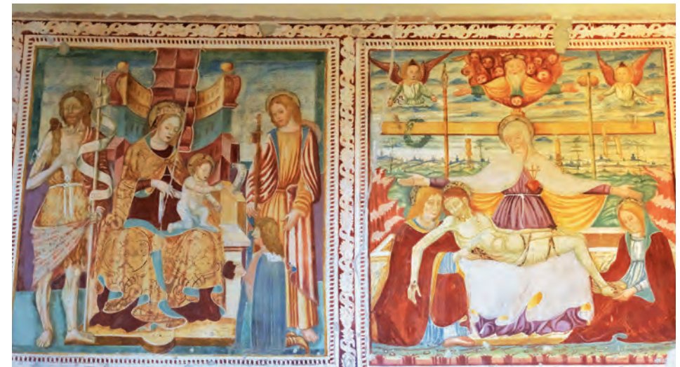
Marcaria, Chiesa cimiteriale di San Giovanni Battista, fine sec XV.

La vittoria di Beethoven non è soltanto quella di un uomo solitario. Egli ha vinto per tutti.