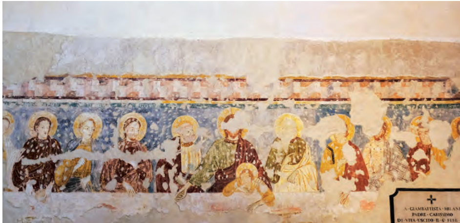
Massimbona, San Pietro in Vincoli, Ultima Cena, pittura lombarda del '300.

Al termine, visita guidata ai mosaici pavimentali del XIII secolo