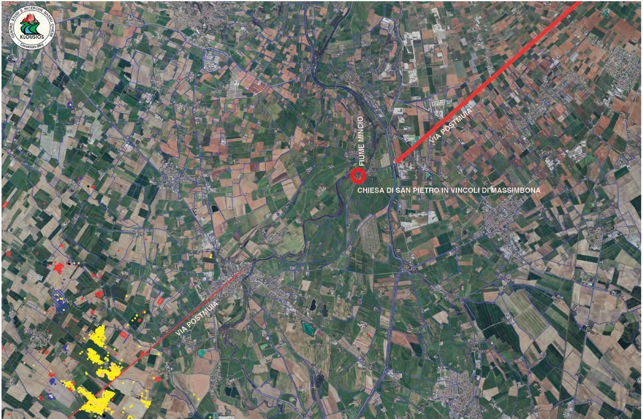
La Chiesa di Massimbona in Goito tra il fiume Mincio e la via Postumia